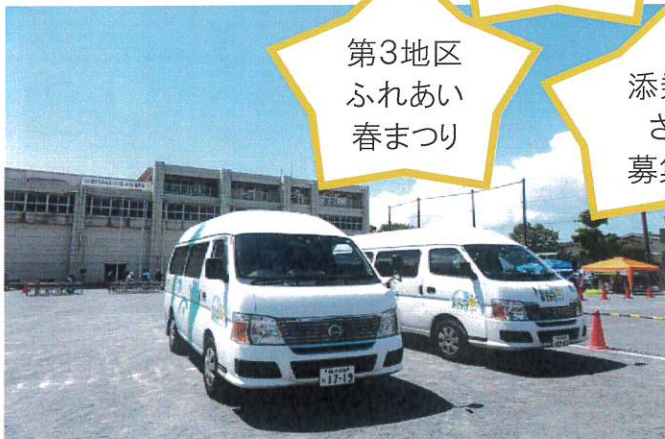
第3地区 ふれあい 春まつり