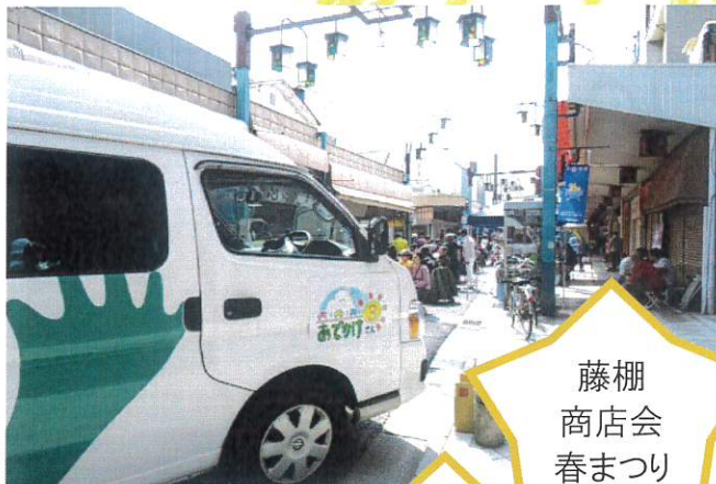
藤棚 商店会 春まつり