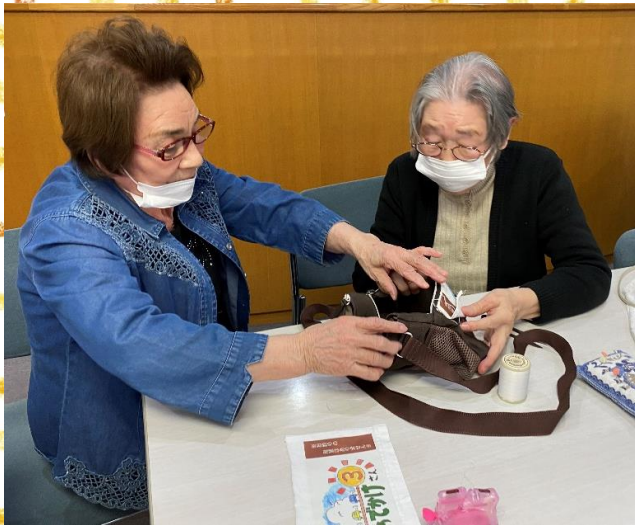
手芸ボランティア『キラキラ会』 裏地の見栄えにもこだわります。

この度、藤棚地域ケアプラザで活躍する手芸ボランティア団体『キラキラ会』さんが集金バッグを手縫いでリニューアルしてくださいました！ アイロンでプリントしたものをバッグ前面に縫い付けます。バッグの生地が厚くて大変な様子です！ 二人がかりで針をグイグイ、2日間に渡り、作業をしてくださりました！ 右の写真が完成品！ 鮮やかに生まれ変わったバッグをぜひご自身の目でご覧ください！